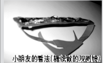
小朋友的看法(糖纸做的观测镜)