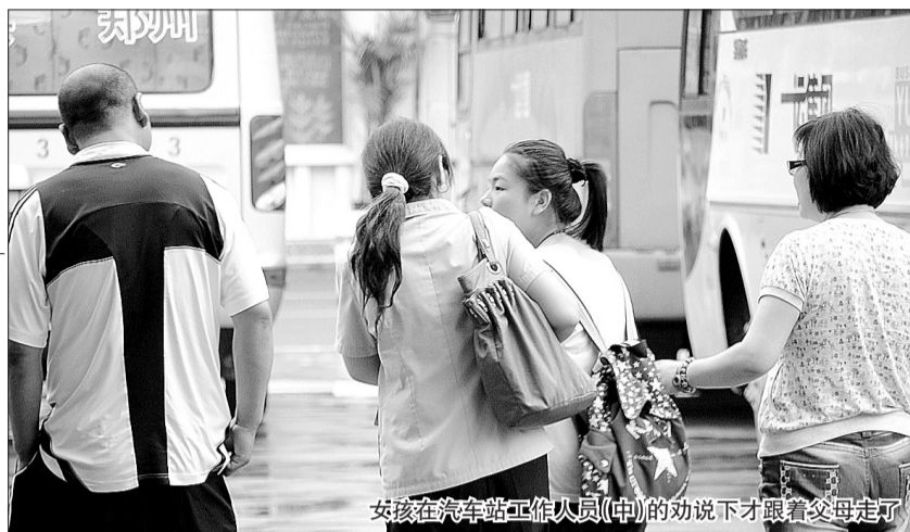
女孩在汽车站工作人员(中)的劝说下才跟着父母走了