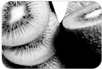
▲▼猕猴桃、柑橘,一天一两个就够了