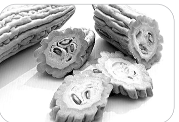
▲▼苦瓜和花菜维C含量都比西红柿高