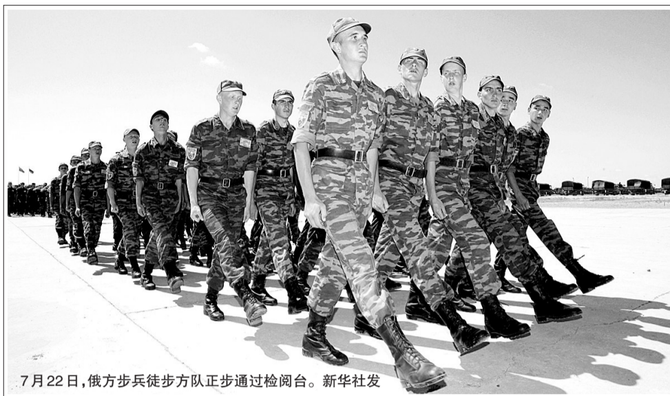
7月22日,俄方步兵徒步方队正步通过检阅台。