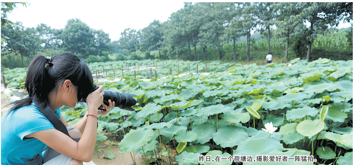
昨日,在一个荷塘边,摄影爱好者一阵猛拍。