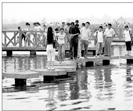
龙湖游人“踏水而行”