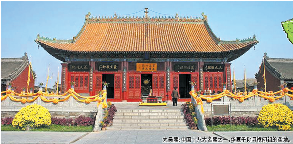
太昊陵：中国十八大名陵之一，华夏子孙寻根问祖的圣地。