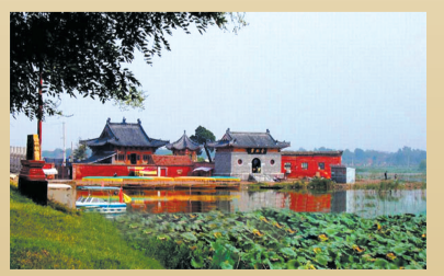
画卦台:伏羲曾经画八卦之地。