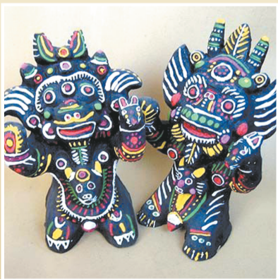
泥泥狗:太昊陵泥玩具的总称,淮阳太昊陵独有,被誉为“天下第一狗”。专家评价其为“真图腾、活化石”。

据了解,2007年,淮阳文化旅游产业实现收入12.7亿元,占GDP的16.6%;2008年,这一数字为15.1亿元,占GDP的比重为17.8%。今年的朝祖会,客流量达到1200多万人次,景区景点门票收入4200万元,旅游综合收入已达23.6亿元。