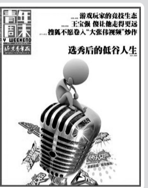
《青年周末》第174期 选秀后的“低谷”人生

我们试图从纷乱的历史线索中,还原这个声望远播的家族的故事,再一次体验他们的冲突与转变、困境与出路、理想与现实、希望与失落,理解他们生活的时代与社会的各种偶然与必然。在丰富我们对历史的理解之外,更希望他们的故事可以给今天的我们以启迪,以鼓舞。这或许是对他们最好的纪念。