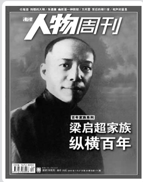
《南方人物周刊》2009年第29期 梁启超家族 纵横百年

火山岩形成的直立六边形岩柱群是一种自然奇观。没有人知道中国大地上到底有多少这样的景观,因为还有许多石柱在地下埋着呢。为此,摄影师和文字作者赶赴全国各地,寻找暴露于地表之上的岩柱群。可以肯定,中国仍有不少地方的石柱群没有进入我们的视野,但相信这组报道所展露的各地石柱群已经足够让人们赞叹了。