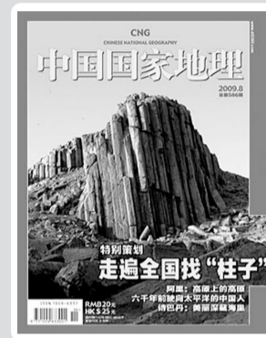
《中国国家地理》2009年第8期 走遍全国找“柱子”

地标,一座座凸起在中国的大地上。在你身边正发生这样的事:20年前叫榕树头的老地方,明年就要改名金融中心;20个月前的空地,下个月最新的中国最高楼就会竣工。城市正用匪夷所思的进度,种下如此之多的庞然大物:它们或奇形怪状,或遮天蔽日,或一柱擎天,要逐渐取代你最习惯的地理坐标,去代表这个幻觉与速度交织的城市。