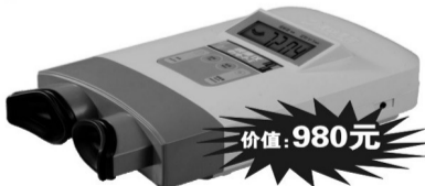
清华同方视康仪 价值:980元

大学路54号河医立交桥头路西 眼宝健康中心 人民路16号(11中路对面) 眼宝专卖店 黄河路与花园路交叉口向西100米路北 眼宝专卖店