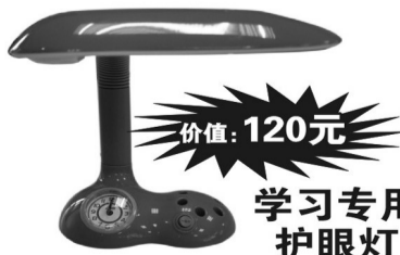
学习专用护眼灯 价值:120元