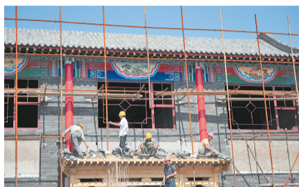
原址新建的仿古一条街——乔家金街,将再现晋商文化。