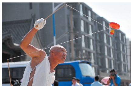
抖空竹的老人穿的是老式服装,玩的是传统玩意儿,但他身旁的城市已完全是现代景象。