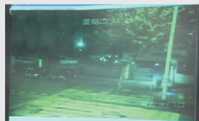
21:25:54 “关键的29秒”期间画面很平静