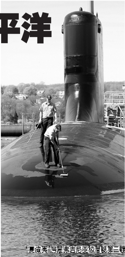
“夏威夷”号是弗吉尼亚级潜艇第三艘