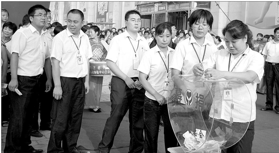
超市的商户在为贫困家庭捐款