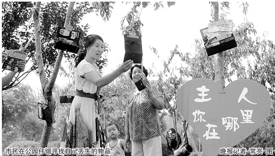
市民在公园仔细寻找自己丢失的物品。

据了解,夏季人们衣衫简单而且兜较浅,手机、钱包等在蹲坐时容易脱落。“从2008年扩园以来,工作人员在工作期间共捡到近200个包,其中很大一部分已被认领。”该公园负责人介绍,如果你想找自己的物品,可拨打文化公园认领电话63282340。 线索提供 王玉忠