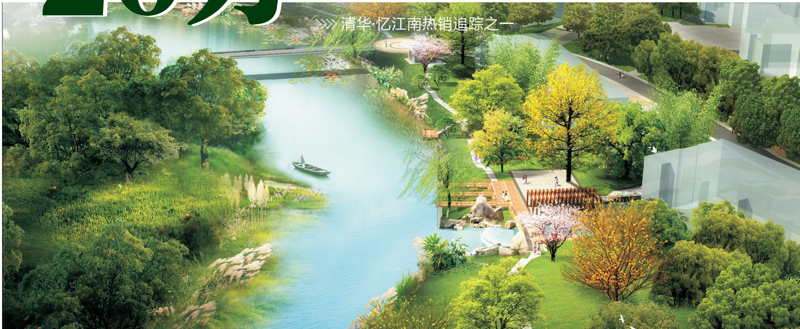
清华·忆江南热销追踪之一