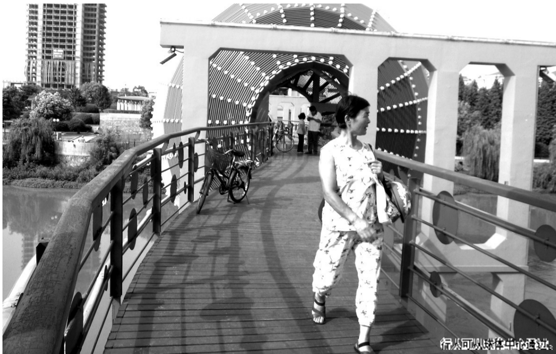
行人可以从球体中心穿过。