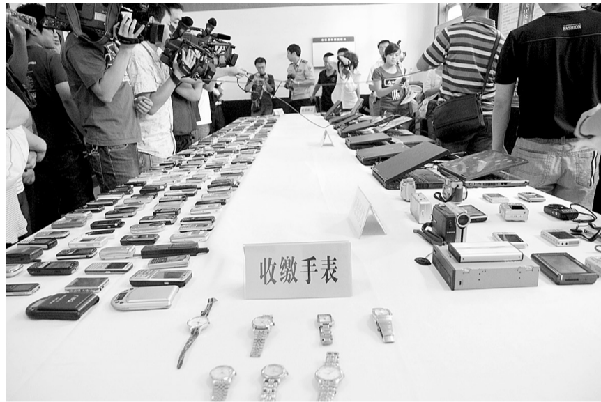
这些赃物只有实际物品数量的1/3