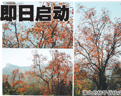
满山的柿子俏枝头

来到景区,登上巍巍卧龙岗观赏初秋五彩斑斓的红叶林,登山健身、采摘山枣、野葡萄等,还可以与花果山的野生猕猴同乐,到双龙峡观蛤蟆潭、野猪潭、三叠瀑布、双龙瀑布、天池等优美景点。玩累了,到农家小院吃美味农家饭,山韭菜炒鸡蛋、手工面条、清炖小柴鸡味道十足,当地特色卤肉可