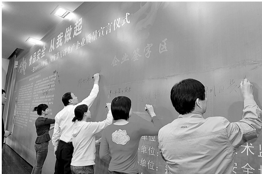
郑州市的月饼制作商齐聚黄河饭店,共同签下自己的名字。