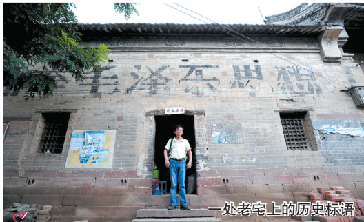
一处老宅上的历史标语