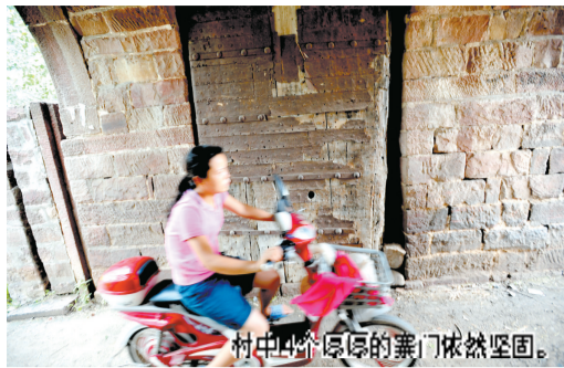
村中四个原原的寨门依然坚固。