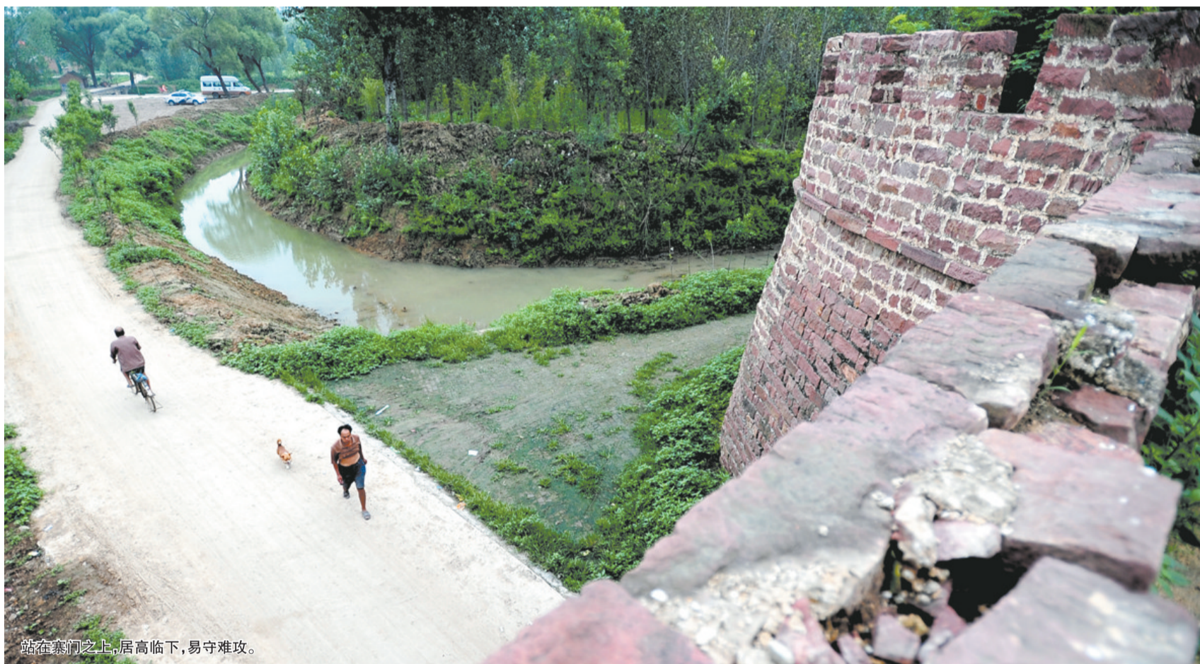
站在寨门之上,居高临下,易守难攻。

红色的寨墙,高高的城垛,厚重的寨门,蜿蜒的护寨河和古寨里古朴沧桑的明清建筑,走进平顶山郟县堂街镇临沔寨,就像走进历史深处,一段段往事和传奇,伸手可以触摸。