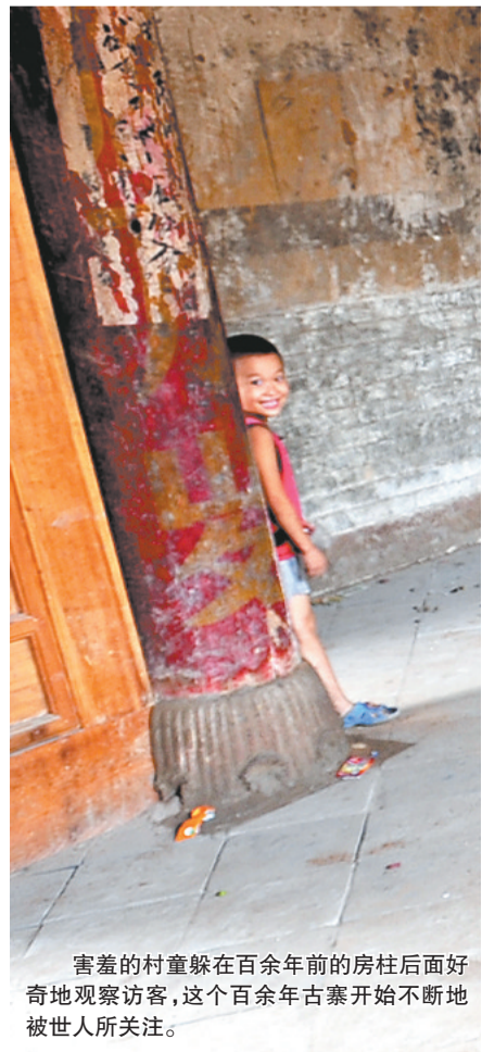
害羞的村童躲在百余年前的房柱后面好奇地观察访客,这个百余年前古寨开始不断地被世人所关注。