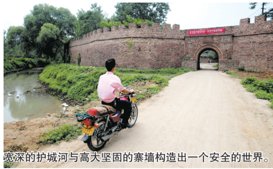
宽深的护城河与高大坚固的寨墙构造出一个安全的世界。