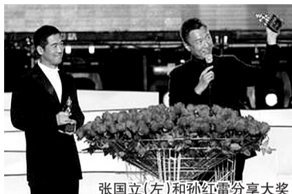
张国立(左)和孙红雷分享大奖