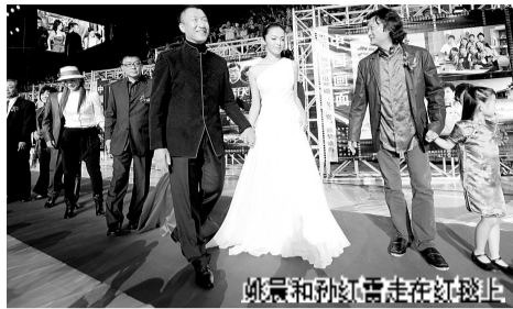
孙红雷和张国立走在红毯上

作为中国电视剧唯一的“政府奖”，第27届“飞天奖”昨晚在水立方完美落幕，共有30余个剧组、300余名明星到场助阵，规模盛大空前。昨晚飞天奖所有奖项均已尘埃落定。而和不久之前的华表奖一样，此届飞天奖再现“一团和气”的大团圆局面，多部不同题材的优秀电视剧共同获奖，就连备受瞩目的优秀男、女演员也延续了“双黄蛋”的流行趋势。