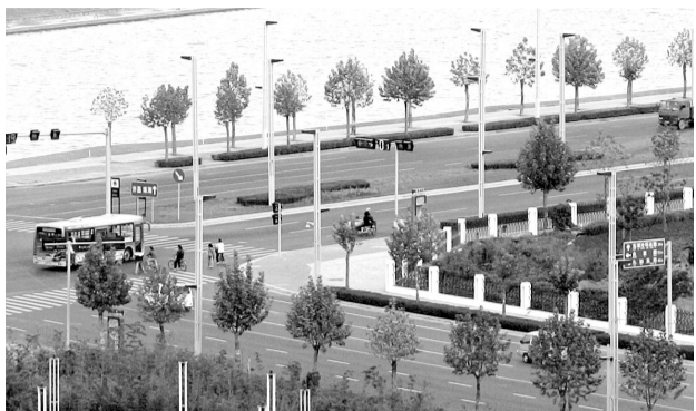
郑东新区部分道路“隔离栏”就是绿化带 晚报记者 赵克 图