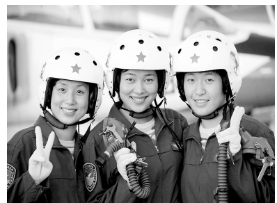
教练机梯队的三个“领军人”

国庆60周年阅兵方阵中有三支“娘子军”:三军女兵方队、女民兵方队、女飞行员梯队。