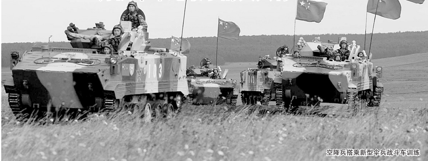
空降兵搭乘新型全兵战斗车训练