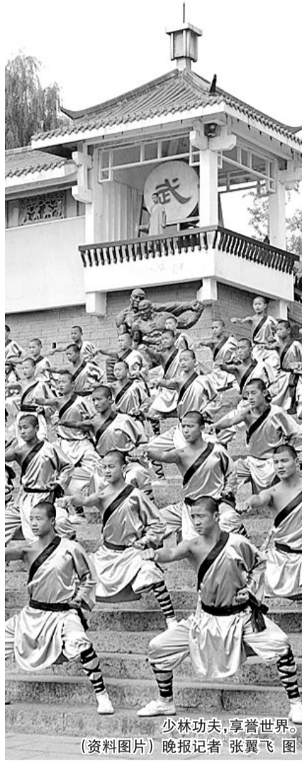
少林功夫,享誉世界。(资料图片) 晚报记者 张翼飞 图