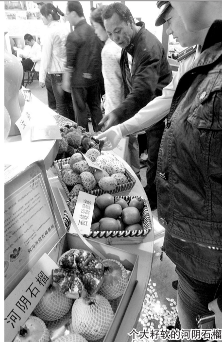
个大籽软的河阴石榴