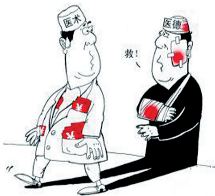
图/李嘉(请作者联系本报)

日前,卫生部发布《关于医师多点执业有关问题的通知》,明确医师可以多点执业,至此,医师“走穴”步入合法化时代。(详见本报A26版)