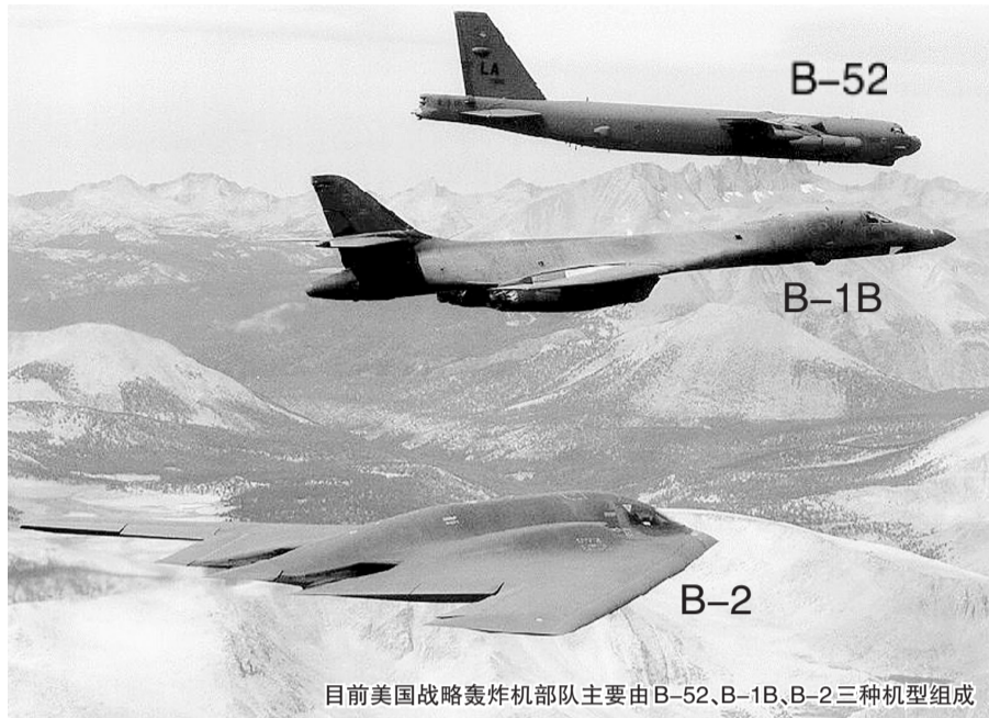
目前美国战略轰炸机部队主要由B-52、B-1B、B-2三种机型组成

至于这种新型轰炸机的具体性能和采购单价如何,现在还难以定论,要看原型机何时出来以及美国空军的订购数量。现在包括美国的智库都是根据蛛丝马迹加以猜测,如兰德公司的分析认为,新型轰炸机应以2马赫(1马赫为340米/秒)的速度巡航,载弹量为6-9吨,在无需加油的情况下航程超过5000公里。但据此来看,只能算是中型和中程轰炸机。而美国科学家联合会的分析则认为,新型战略轰炸机的载弹量要超过B-52的27吨,但如此庞大物要做到超音速巡航和隐形就比较困难。