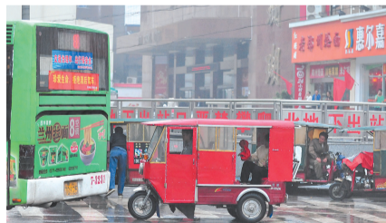
乱停乱放的三轮车是整治对象之一。