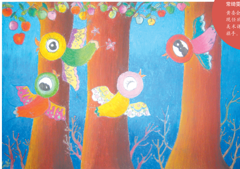
《好朋友》11岁作于列奥纳多 38.2cm x 26.7cm

常绮雯 11岁 黄委会小学六年级(3)班 现任班级的轮值班长、 美术课代表、学校的护旗手。