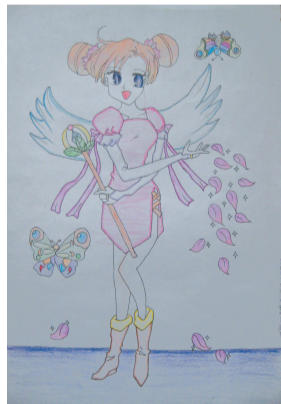
《美少女》9岁作于列奥纳多 26.7cm x 38.2cm