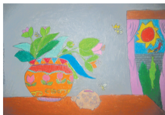
《窗外有阳光》8岁作于列奥纳多 38.2cm x 26.7cm