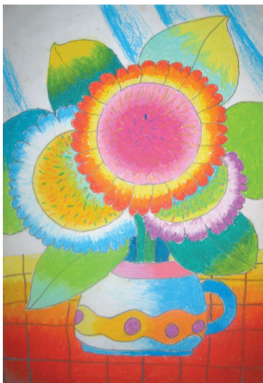
《向日葵》8岁作于列奥纳多 26.7cm x 38.2cm