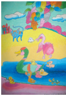
《快乐的时光》9岁作于列奥纳多 26.7cm x 38.2cm