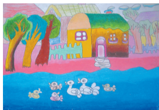
《我家门前》10岁作于列奥纳多 38.2cm x 26.7cm