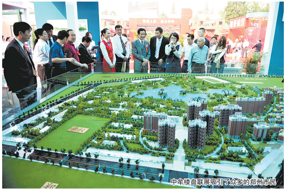
中牟楼盘联展吸引了众多的郑州市民

家家楼盘都让利,还有汽车大奖等你拿 本届中牟品牌地产联展历时4天,来自中牟25个优秀楼盘项目首次在郑州组团亮相,比如怡海嘉园、水木清华、郑东新世界、天湖等,感兴趣的市民可前往省人民会堂观展。在房展会期间购房,几乎每家楼盘都让利,最高可达2万元,还可参加QQ轿车10年使用权的抽奖。