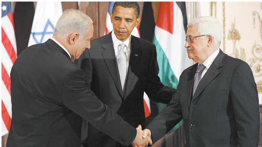
美国总统奥巴马(中)9月22日主持在纽约举行的三方会谈时,与以色列总理内塔尼亚胡(左)和巴勒斯坦民族权力机构主席阿巴斯在一起。