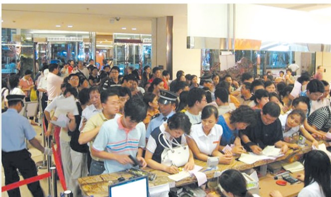
黄金周里的红星·美凯龙

郑州红星·美凯龙全球家居生活广场二期工程自2008年下半年启动,经过近一年的紧张施工,二期建材店将于10月30日进行试营业。据悉,随着二期建材馆的启动,郑州红星·美凯龙在规模、品质及品类细化上已经成功与国内一线城市接轨。 万佳 张真