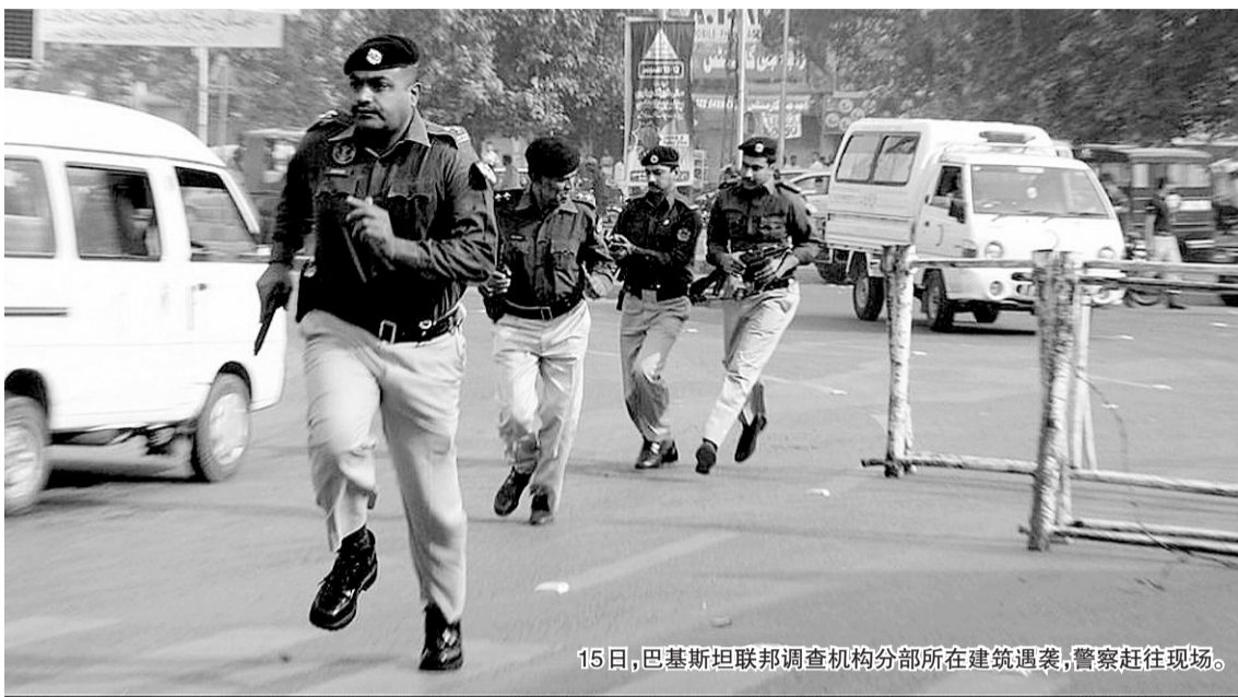
15日，巴基斯坦联邦调查机构分部所在建筑遇袭，警察赶往现场。

巴基斯坦武装人员15日在东部城市拉合尔、西北部城镇科哈特实施多起袭击，致使至少39人死亡。一些分析师认为，当天连串袭击可能与塔利班武装组织有关。