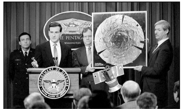
1996年,诺泽特(右二)在五角大楼出席新闻发布会。

曾效力五角大楼的美国科学家斯图亚特·戴维·诺泽特19日因涉嫌向以色列出售情报被捕,于20日在首都华盛顿首次出庭受审。美国联邦调查局(FBI)一名特工伪装成以色列情报人员“钓”诺泽特,后者果真“上钩”。