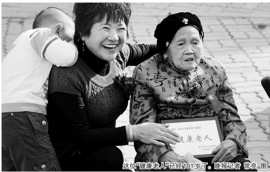
这位“健康老人”已经101岁了。