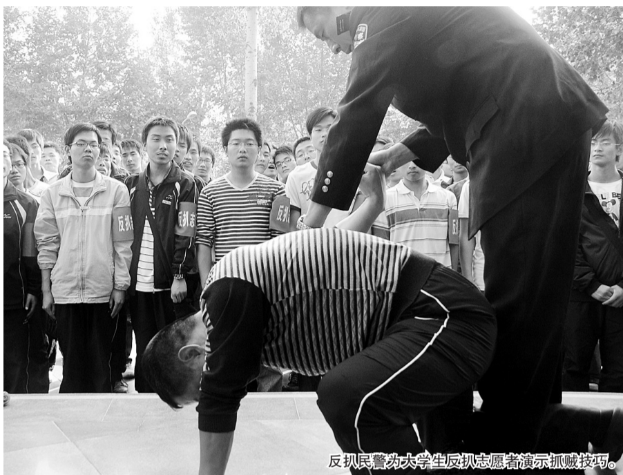
反扒民警为大学生反扒志愿者演示抓贼技巧。

据介绍，周六下午、周日上午，全市2000名大中专院校学生将会在市区各大商场、医院等复杂公共场所佩戴袖标，公开执勤，开展巡逻防范。