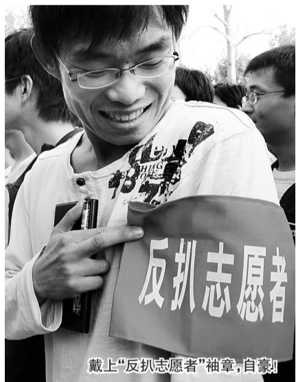
戴上“反扒志愿者”袖章，自豪！

河南农大的一位老师提醒：“大学生反扒志愿者走上街头，有利于弘扬见义勇为的风气，但他们的行为同样受到法律的约束，所以一定要冷静谨慎地处理问题，既要注意自身安全，也要注意避免出现违反法律的过激行为。”