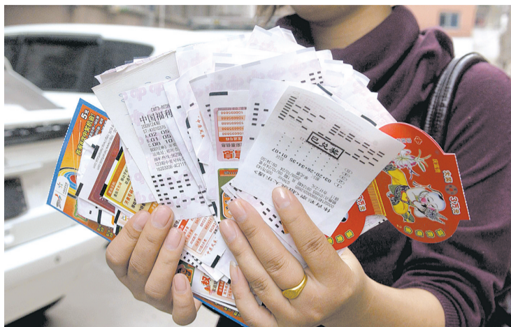
昨天上午,记者见到了小张用2.9万元换来的彩票。

昨日2时许,经八路巡防队队员巡逻到经七路与红专路交叉口时,发现一名穿着工作服的女子坐在马路台阶上不停地抹眼泪,她旁边站着一名男子。