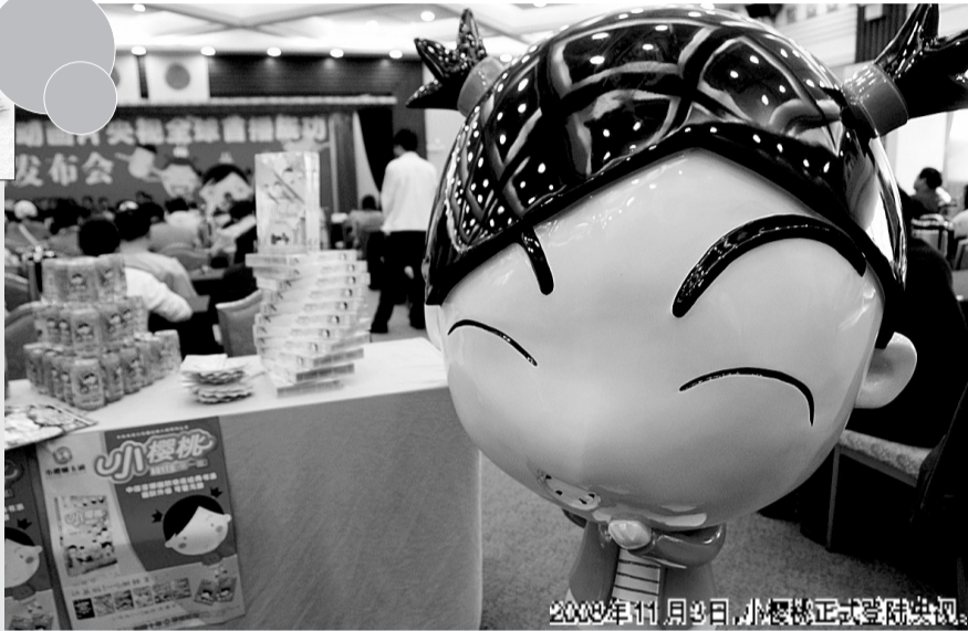
2009年11月9日,小樱桃正式登陆央视。