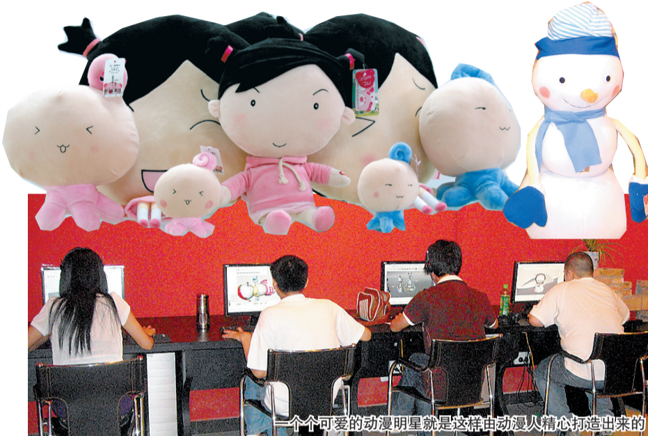
一个个可爱的动漫明星就是这样由动漫人精心打造出来的

目前,郑州市已将动漫产业列入跨越式发展新3年行动计划,并在去年拨出5000万元扶持资金专项扶持。值得一提的是,在政府对动漫产业的扶持政策中,最受动漫企业关注的是对原创动画片的播出奖励。