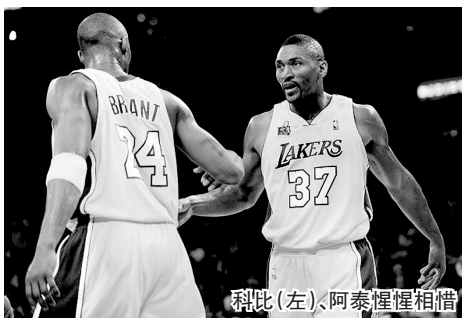
科比(左)、阿泰惺惺相惜