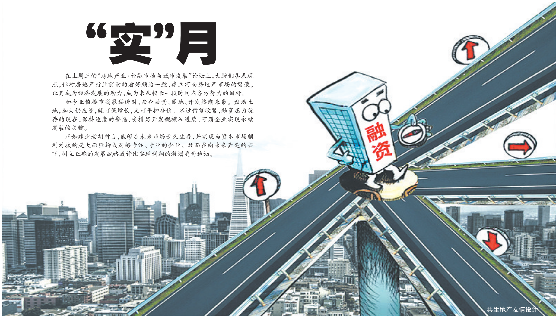
共生地产友情设计

正如建业老胡所言,能够在未来市场长久生存,并实现与资本市场顺利对接的是大而强抑或足够专注、专业的企业。故而在向未来奔跑的当下,树立正确的发展战略或许比实现利润的激增更为迫切。