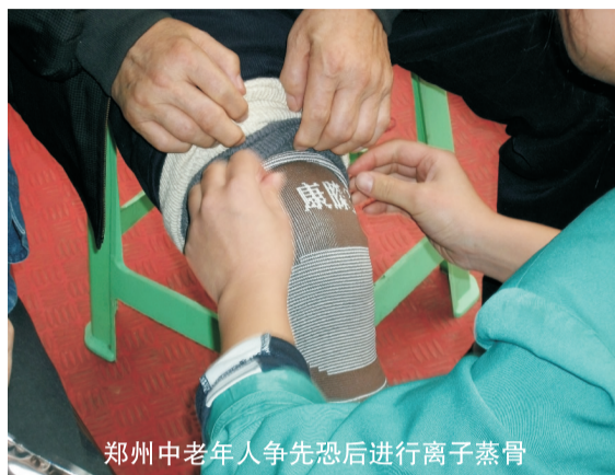
郑州中老年人争先恐后进行离子蒸骨

上周末，小雨连绵，天气转冷，老骨刺、老寒腿、关节炎的苦日子又到了！可是，接受离子蒸骨的人们，个个无恙。