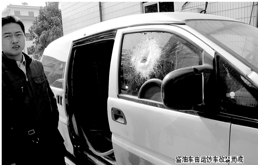
盗油车由运钞车改装而成