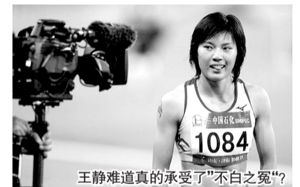
王静难道真的承受了“不白之冤”?

在济南进行的第十一届全运会女子100米比赛中,福建选手王静夺冠,但赛后她被查出使用兴奋剂,金牌被收回,并可能面临终身禁赛处罚。但福建队方面表示这一事件是“有人陷害”,王静未使用兴奋剂。