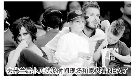
去米兰后小贝就没时间现场和家人看NBA了