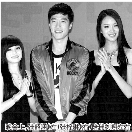
晚会上,张韶涵(左)张梓琳(右)陪伴刘翔左右

刘翔化身“小偷”在街头上演百米“跨障”冲刺,“警察”成龙则在后面紧追不舍。这不是梦,而是未来《警察故事》中一个可能的场景。