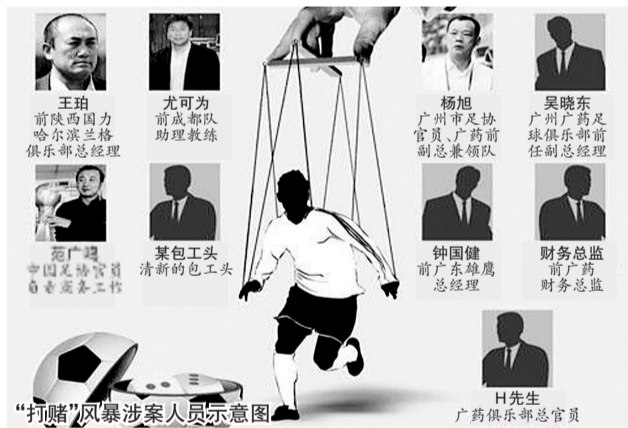
“打赌”风暴涉案人员示意图

比分领先四川，但终场前青岛队员却多次吊射本方球门。“吊射门”发生后引发了诸多传言，很多圈内人士认为这场球肯定跟赌球有关，而且肯定有人重仓买了大球。事后，中国足协迫于压力，对此事进行了调查，但得出的结论却含混其词，甚至称“是吊射还是回传难以界定”。公安部门抓赌打假报道后，外界一直认为青岛海利丰有关人员被警察叫去谈话只是时间问题，果然近日就有媒体报道称“‘吊射门’已经被移交警方”查处。