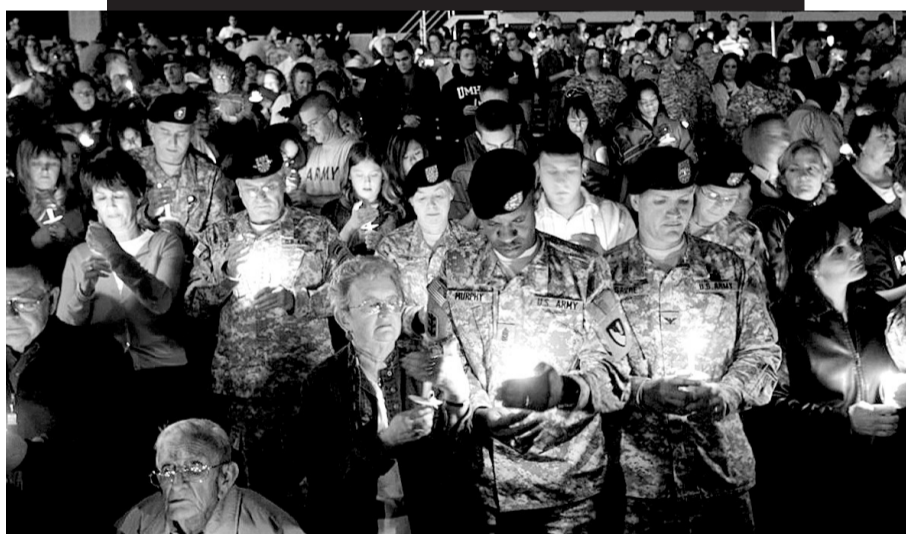
胡德堡基地10日为枪击遇难者举行悼念仪式。