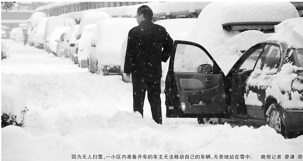
因为无人扫雪，一小区内准备开车的车主无法移动自己的车辆，无奈地站在雪中。