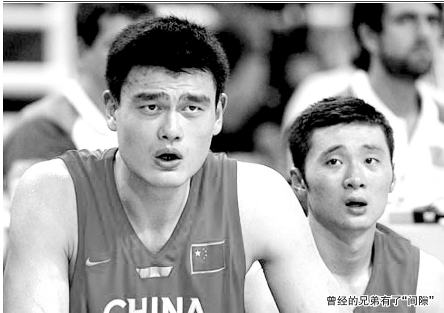
曾经的兄弟有了“间隙”