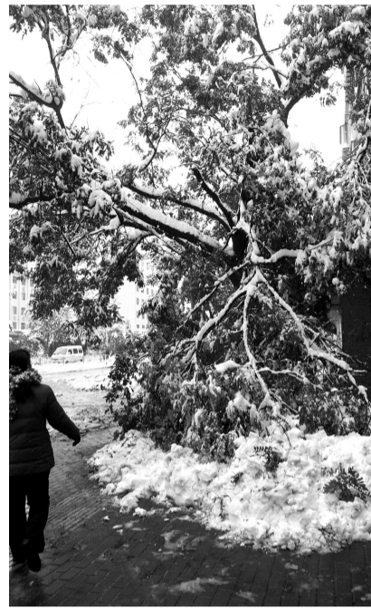
陇海路上一株被压断枝干的大树。