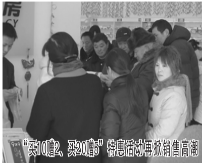
“买10赠2、买20赠5”特惠活动再掀销售高潮

近日，9块9藏方透骨神贴自从开展“买10赠2，买20赠5”特惠活动以来，全市药房3天共累计卖出10万多盒，此次活动优惠幅度史无前例，多年的老风湿、骨病患者拍手叫好，自己买的，给爸妈买的，给老伴买的，有的是给亲人买的.....9块9藏方透骨神贴送家人送朋友，送关怀、送健康，送情谊。